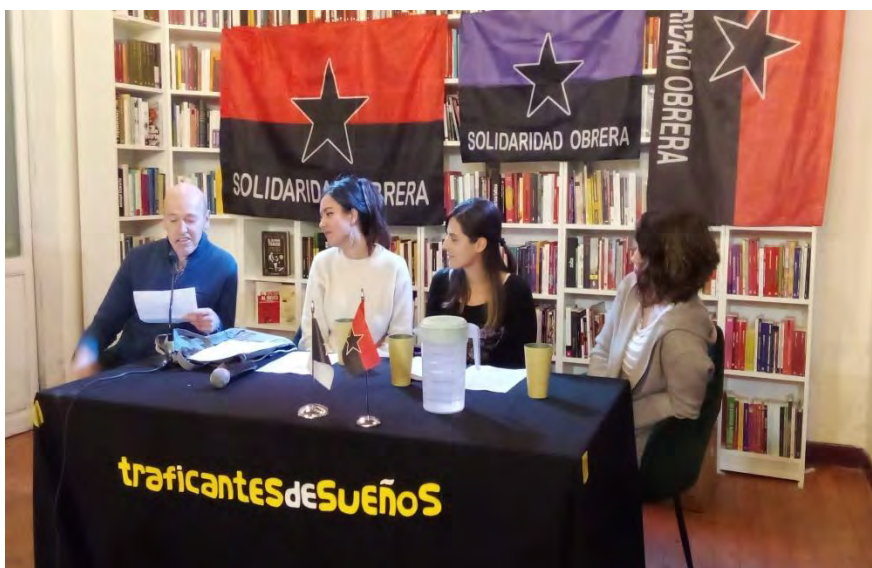
Imagen de la entrega de premios del XXI Certamen de Relato Breve Raimundo Alonso, organizada por Solidaridad Obrera en la librería Traficantes de Sueños de Madrid, el pasado diciembre.